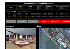
ドローン物流システム