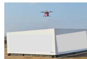
宅配ロッカー型 ドローンポート